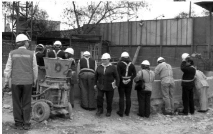
En septiembre, Ciudad Viva organizó una visita a las obras del Metro para una delegación de dirigentes de la Vega Chica, la Pérgola Santa María y otros interesados.