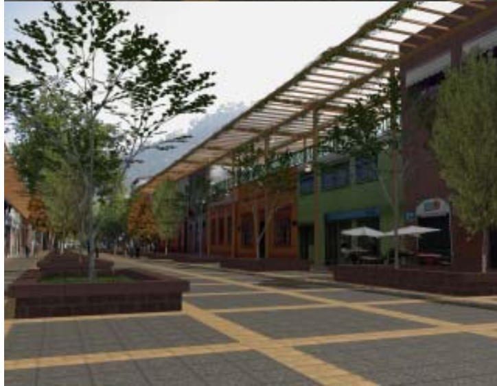
1. Una vista desde el aire de como se podría cambiar la pavimentación para darle prioridad a peatones y ciclistas, reduciendo velocidades y mejorando el aire y la seguridad del barrio. 2. Una forma de mejorar la Feria Artesanal y 3. el espacio entre la Feria y la Escuela de Derecho. 4, 5, 6. Convirtiendo la calle y sus interiores en una “rambla” que enfatiza Pío Nono como punto de conexión entre parques y áreas verdes.