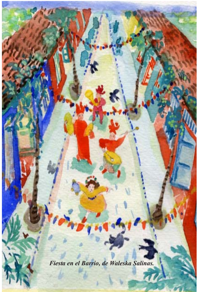
Fiesta en el Barrio, de Waleska Salinas.

Tenemos un grupo de jóvenes artistas trabajando duro desde hace meses para armar presentaciones de baile, teatro, fotos, música, esculturas; tenemos un Living Abierto y stands con las organizaciones comunitarias y ONGs; están listos los equipos de fútbol femeninos de la Vega Chica; seguridad del tránsito con CONASET; mini-cursos de ciclismo para niños y mujeres; un taller de reparación de bicicletas; actividades en el Parque Metropolitano; y mucho más. También hay un espacio para los que quieren traer sus