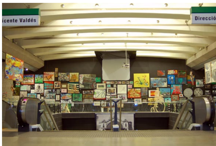
Estación Quinta Normal, improvisada galería de arte en la ciudad