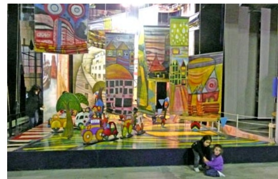
La Isla de los Inventos, donde los niños y niñas imaginan su ciudad ideal

El próximo congreso será en el 2012 y, a pesar de que se desconoce el lugar sede, entre los países candidatos para este encuentro está Chile. Esta sería una gran oportunidad para nuestro país de discutir sobre temas de democracia y generar instancias para plantearse las falencias que tuvo este III Congreso, como la falta de estudiantes y de organizaciones sociales, que fue uno de sus lados más débiles, además de la mala organización que tuvieron para el sábado 15 de mayo en el Centro Municipal de Distrito Sudoeste, en donde precisamente se exponía sobre la democracia desde abajo, las organizaciones y redes sociales.