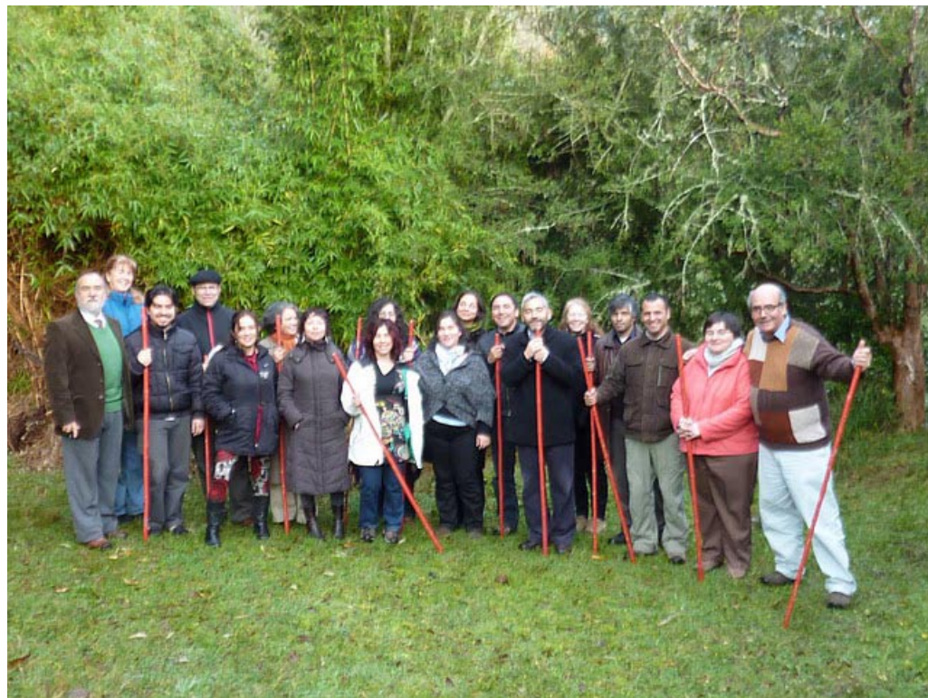
Los miembros de la red reunidos en Panguipulli

Abarcamos especialmente el tema de la comunicación como una herramienta clave para la generación de sinergias, así como para la generación de espacios de real construcción ciudadana, y conversamos también sobre nuestras estrategias para atraer a los medios masivos y poner nuestros temas en discusión en la opinión pública. También